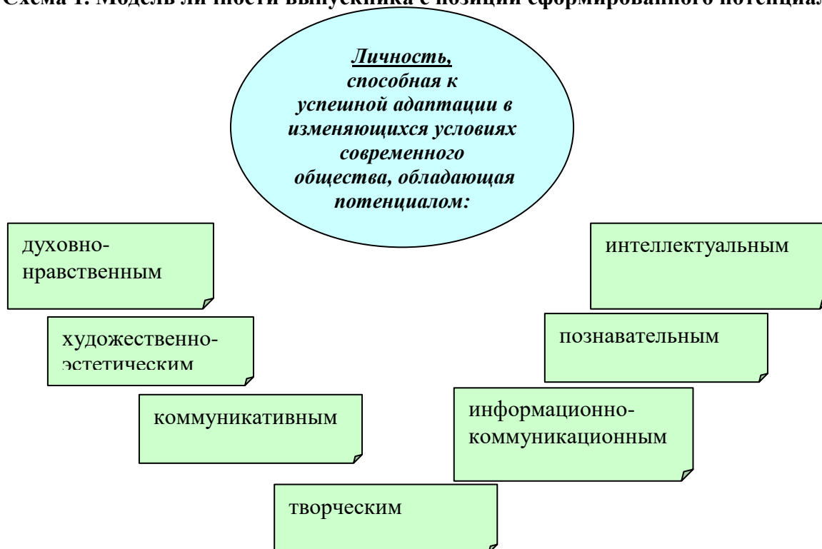
Схема 1. Модель личности выпускника с позиции сформированного потенциала.

При этом у выпускника значимы общечеловеческие ценности, такие как доброта, гуманизм, справедливость, толерантность, сострадание по отношению к ближним.